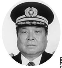
財団法人 日本消防協会 会長 片山 虎之助