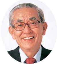
愛媛県知事 加戸 守行

平成二十一年の輝かしい新春を迎え、謹んで新年のごあいさつを申し上げます。 皆様方におかれましては、日ごろから、地域防災の中核的存在として、住民の安心・安全の確保に尽力されますとともに、県政の推進に格別の御理解と御協力を賜っており、厚くお礼を申し上げます。 さて、台風や集中豪雨等が近年多発し、今世紀前半には東南海・南海地震の発生も懸念される中、こうした大規模災害に対応するためには、広域的な連携による消防力の充実が一層重要になっており、今治市朝倉笠松山で昨年発生しました山林火災に際しましても、