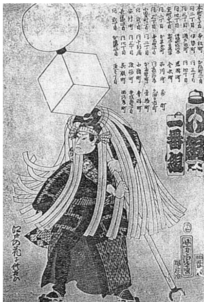
江戸の華、い組の纏 (歌川芳虎画)

町火消が、組の目印として用いたのが纏です。江戸時代に入り太平の世が続くと武家の率(率)は使われなくなり、これに代わって火消が火災現場で用いる表具となりました。