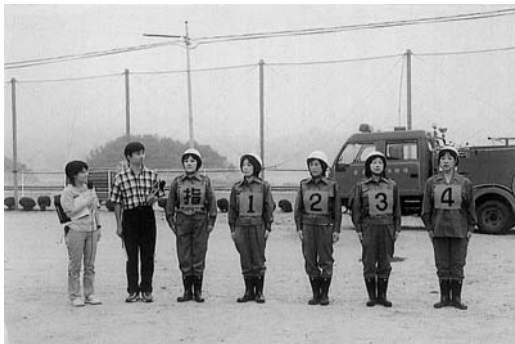
旧生名村時代にNHK伊予路でてくくの取材が来たときの様子