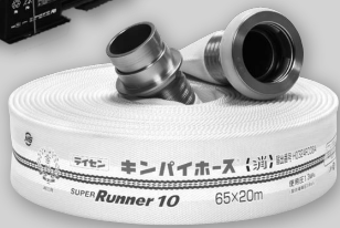
キンパスーパーランナーホース